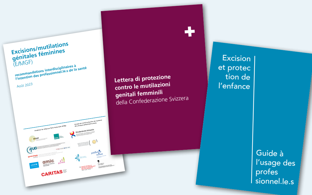
Documentazione di base sulle FGM/C

Ulteriori informazioni e sviluppi attuali sono disponibili sulla piattaforma www.mutilazioni-genitali-femminili.ch . Il sito web è stato realizzato nel 2016 in collaborazione con rappresentanti di varie comunità migratorie, viene aggiornato costantemente e fornisce contenuti in sette lingue per professionisti e comunità.