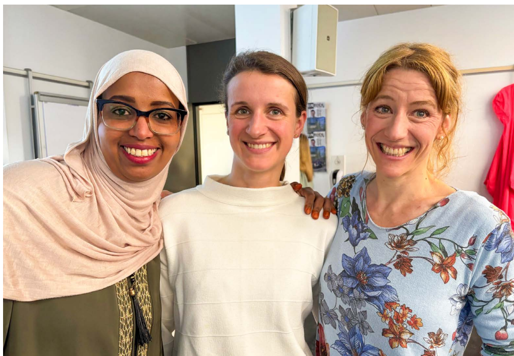
Evento specialistico sulla violenza domestica, maggio 2025

Nel 2025 la rete ha inoltre organizzato circa 15 incontri dedicati alla sensibilizzazione. In tutto hanno partecipato 364 professionisti dei settori sanitario, sociale e della migrazione: un dato elevato molto positivo, poiché una solida preparazione è essenziale per individuare tempestivamente le persone coinvolte e fornire loro un sostegno efficace.