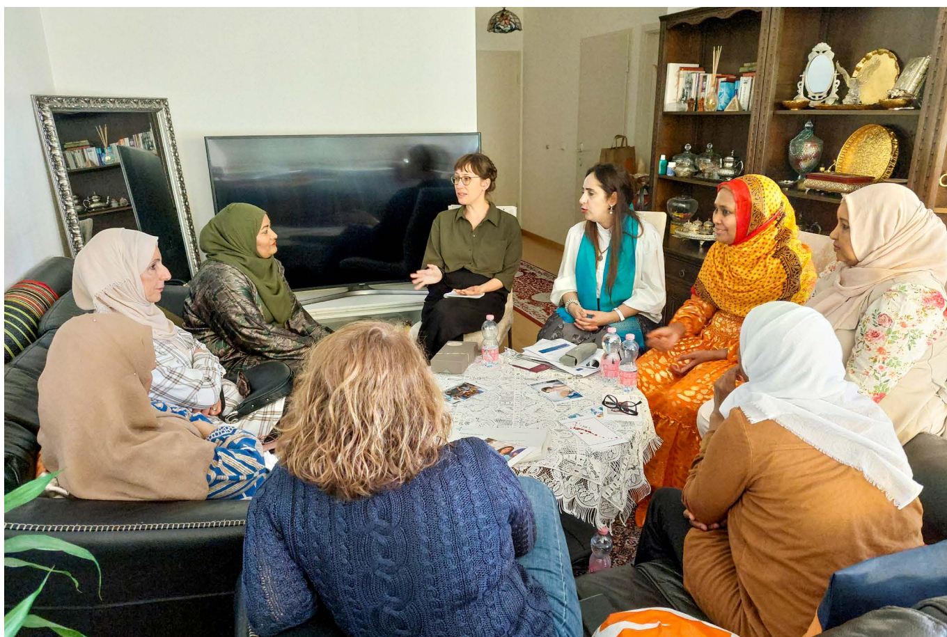
Evento della comunità a Ginevra

è previsto un finanziamento sostanziale della Rete svizzera contro le mutilazioni genitali femminili da parte della Confederazione, dopodiché il futuro è incerto. Nonostante le attuali sfide socio-politiche e finanziarie, non va dimenticato che a molte persone coinvolte le mutilazioni genitali femminili creano sofferenze che durano tutta la vita e costituiscono una violazione dei diritti umani, delle donne e dell'infanzia. Dobbiamo batterci e agire insieme con determinazione contro questo fenomeno.